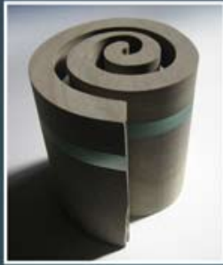
Glasmuseum Rheinbach Himmeroder Wall 6 53359 Rheinbach Tel.: 02226/917501 www.glasmuseum-rheinbach.de