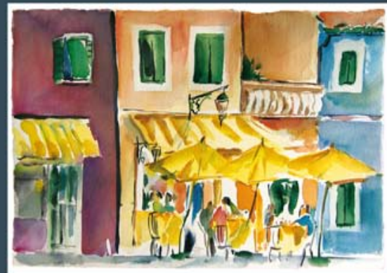
Hans Schönborn Aquarelle + Aquatinta